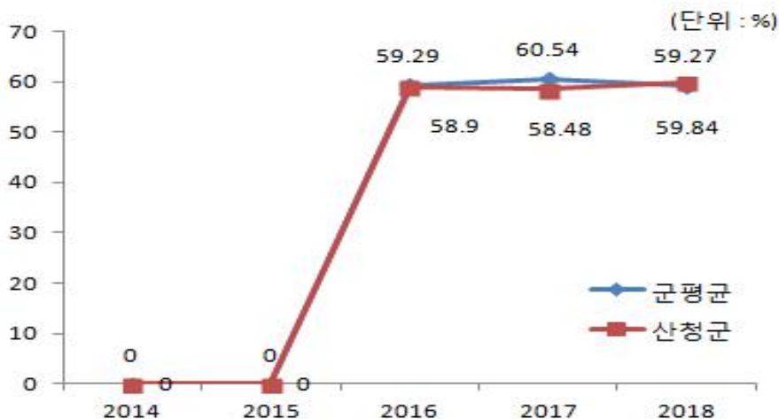
유사 지방자치단체와 재정자주도 비교